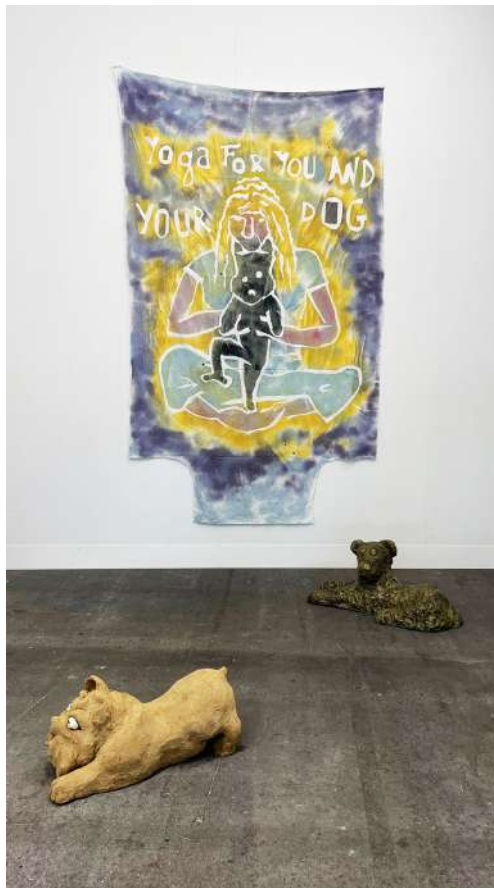
Anaïs Touchot, DOGA 2021, Sandwich Gallery (Bucarest), Liste, Art Basel, Bâle, Suisse