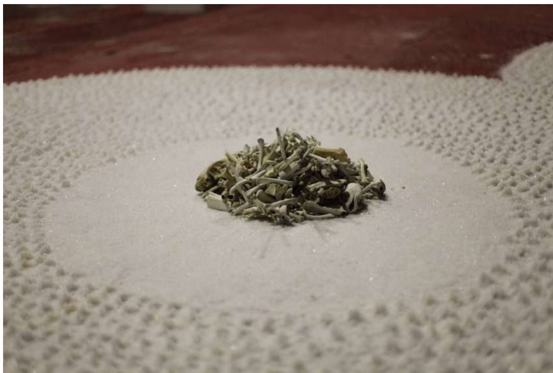
Nico Maria Moscatelli, Territoire du vide , installation 8 x 10 m, fleur-de-sel cueillie à la main, ossements d'animaux habitant les salins, bois flotté, rouleaux concasseurs en pierre du XIX e siècle, Salin des Pesquiers, Hyères, 2022