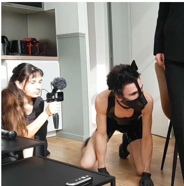
Plateau de tournage du film Une blonde baise avec sa fucking machine devant son Chien-Chien Puppy Please 2021