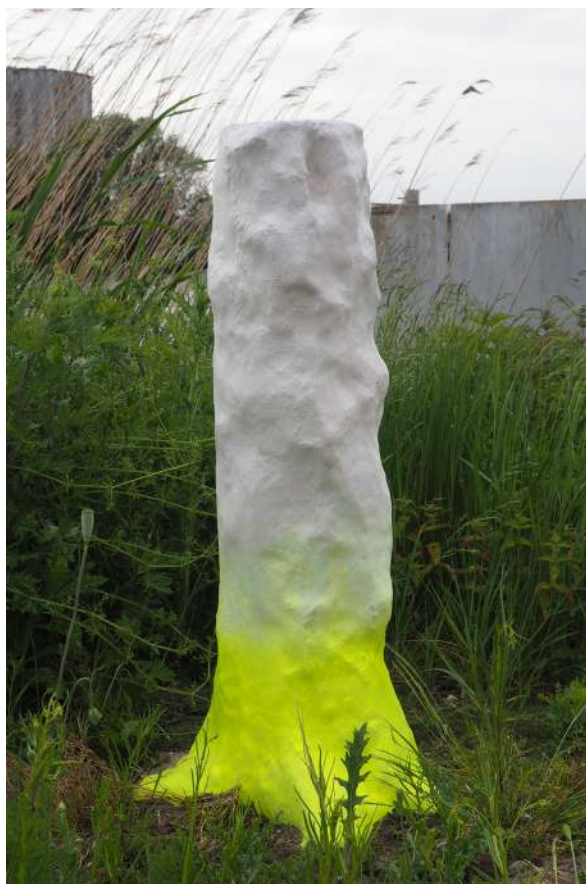
ludovic hadjeras, main/haven tree , résine acrylique, peinture jaune fluo, traces potentielles d'urine de renard, 2024