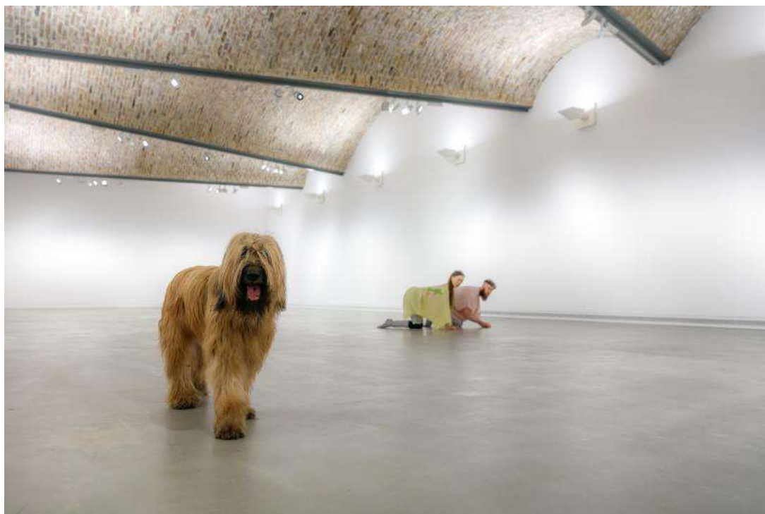
Performances for pets, Vienne, 2017.