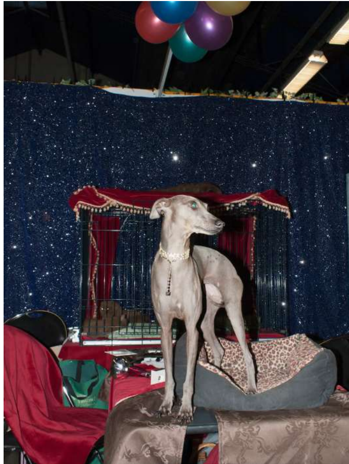
Camille Holtz, Fétiches , photographie, 2015