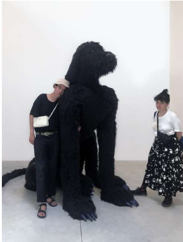
Club Superette, La brave bête, cycle 2 - 2019, sculpture, env. 2m30 x 2m x 1m60 Vue de l'exposition II est une fois dans l'Ouest, Frac Nouvelle Aquitaine, Bordeaux, 2019