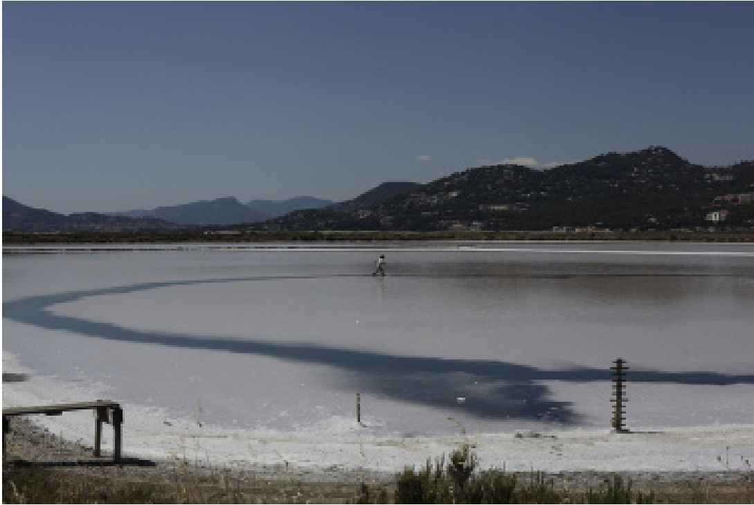
Niccolò Moscatelli, LES MAÎTRES FLAMANTS , action, vidéo 16 min Salin des Pesquiers, Hyères, 2022 Photo : extrait de la vidéo