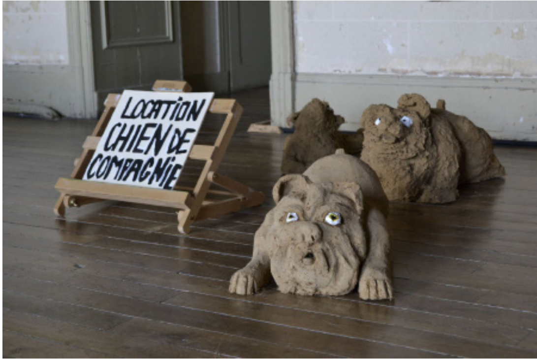
Vue de l'installation dans l'exposition Chiens, humains et autres partenaires , Villa Rohannech, Saint-Brieuc.