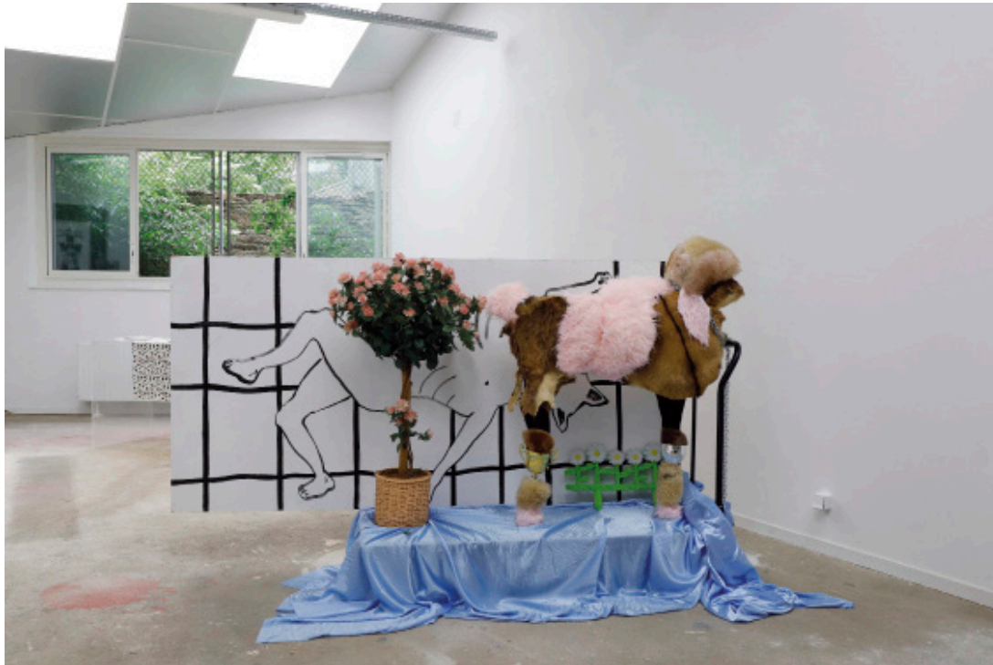
Le dernier show de Curly Rose, Polystyrène, mousse expansive, tiges métalliques, bois, fourrure animale et fourrure synthétique Photo : Johanna Cartier