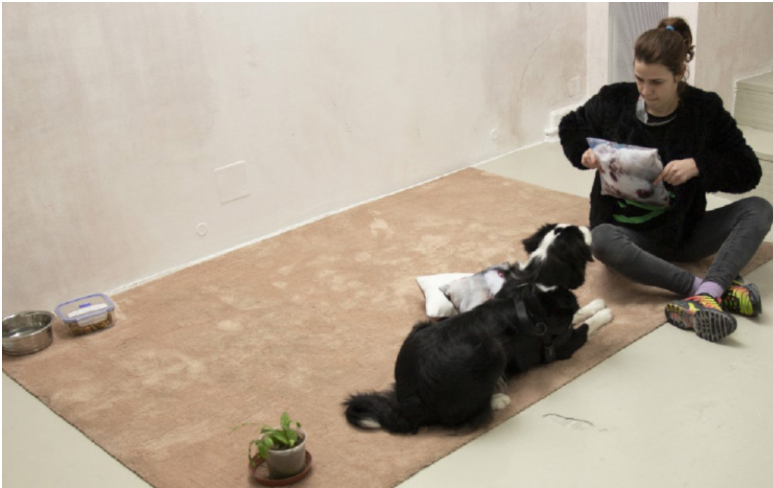
Faites comme chez vous, tapis, coussin à l'effigie de Cayenne, compagne chien de Donna Haraway, biscuits à partager entre humains et chiens, gamelle d'eau, 2020