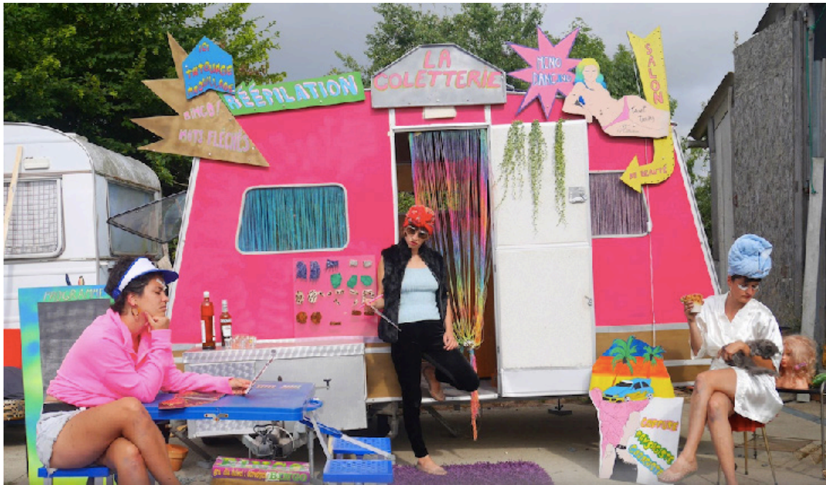
La Coletterie au festival Du Bitume et des plumes à Besançon en 2022