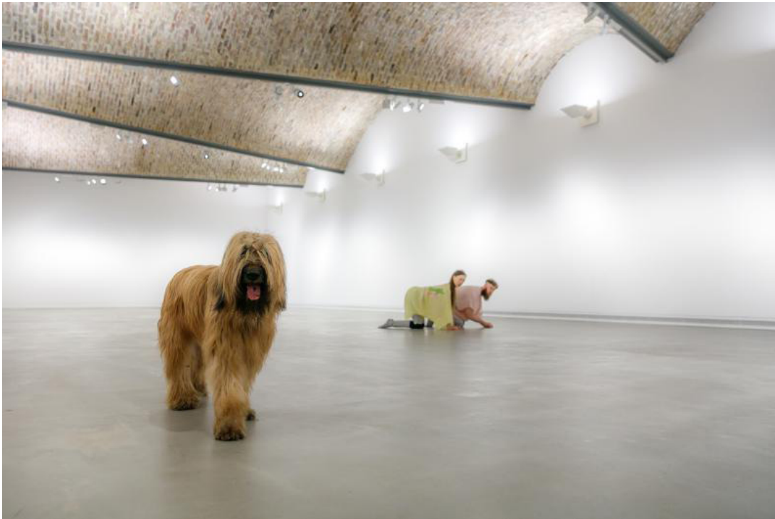
Performances for pets, Vienne, 2017