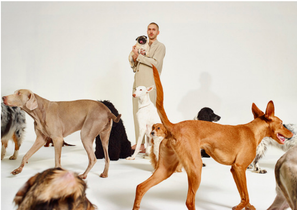
Joseph Schiano di Lombo, Musique de niche , 2021