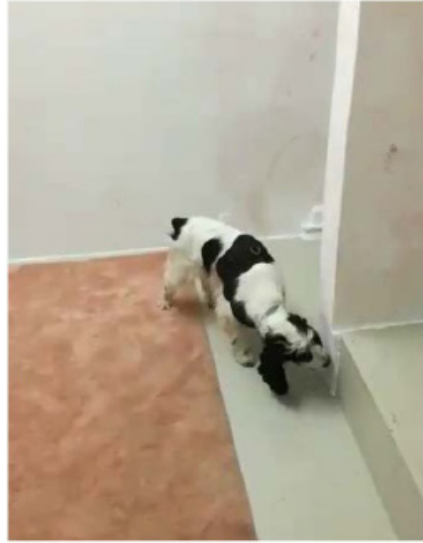
Nouvel ennemi, urine de loup, urine de l'artiste, peinture murale, 2020